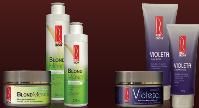
LINHA BLOND MONOI