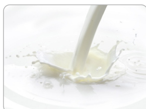
Proteína Hidrolisada do Leite

Ativos Secundários: Colágeno: É hidratante, condicionadora, reparadora, regeneradora e protetora dos fios aumentando sua força e resistência, recuperando sua integridade e melhorando sua elasticidade.