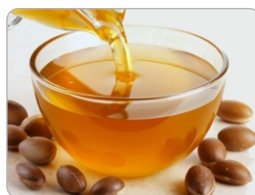
Óleo de Argan