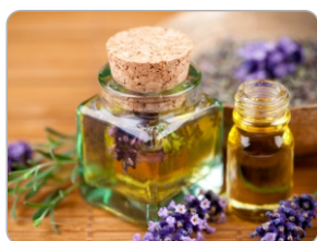
Óleo de Mirra

Óleos Lendários é o mais poderoso blend de óleos para tratamento capilar: